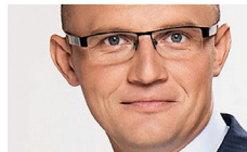
Edmundas Jakilaitis Žurnalistas