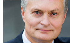
Dr. Gitanas Nausėda Ekonomistas, SEB banko prezidento patarėjas