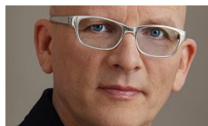
Dr. Kjell Nordström Švedų ekonomistas, filosofas, knogos Funky Business – Talent Makes Capital Dance bendraautoris