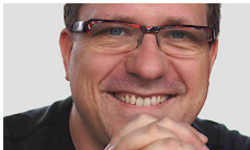
Niels Pflaeging Autorius, influenceris, verslo pokyčių konsultantas