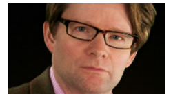
Dr. Kevin Dutton Psichologas, Oksfordo Universiteto eksperimentinės psichologijos profesorius

JUNGTINIS KONFERENCIJOS DALYVIŲ PRANEŠIMAS